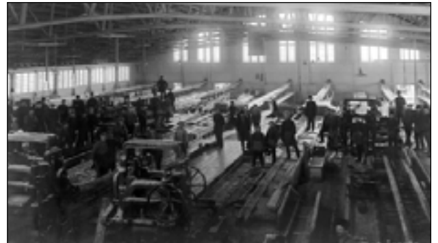
Sågverksinteriör från Norrbyskär 1925.