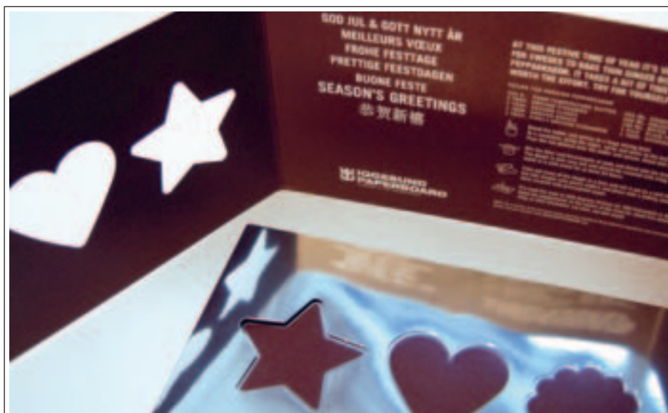
Det är "pepparkaks-känsla" i årets julkort från Iggesund Paperboard – gjort av den nya kartongprodukten Metalprint.

Årets julkort går i pepparkakans tecken och visar möjligheterna till grafiska effekter med den nya kartongkvaliteten Metalprint från Ströms Bruk (se sidan 47). Kortets insida går i pepparkaksfärg med julhälsning och logotype i vitt.